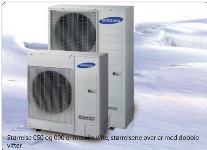
Størrelse 050 og 090 er med én vifte, størrelsene over er med doble vifter

Leveres i 5 størrelser med varmekapasitet fra 5 til 16 kW og kjølekapasitet fra 4 til 14 kW.